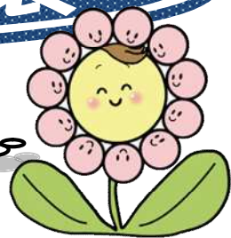
子育て応援イメージキャラクター 『はなたん』