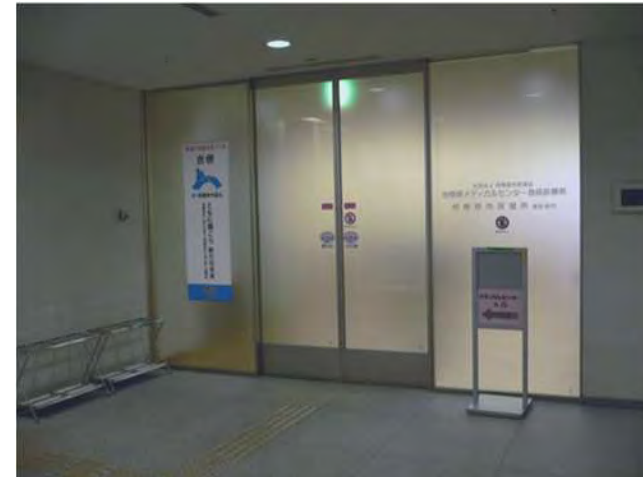
B館1階 メディカルセンター入り口