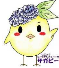
サガピー左手上げ(ロゴ付き)