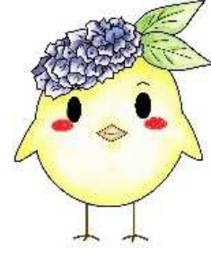
サガピー正面(ロゴなし)