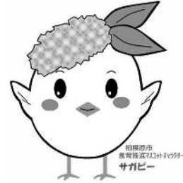
サガビー両手上げ(ロゴ付き)