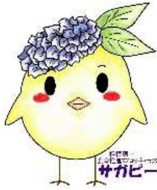
サガピー正面(ロゴ付き)