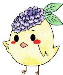
サガピー横向き(ロゴなし)