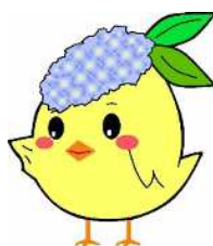
サガピー横向き(ロゴなし)