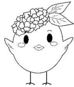
サガビー両手上げ(ロゴなし)