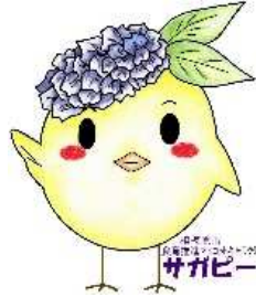
サガピー右手上げ(ロゴ付き)