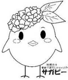
サガビー正面(ロゴ付き)