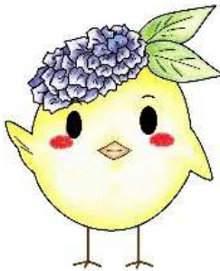
サガピー右手上げ(ロゴなし)