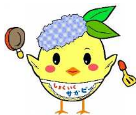
エプロンサガピー