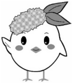
サガビー右手上げ(ロゴなし)