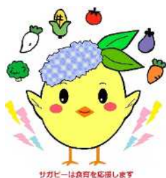
サガピー食育応援