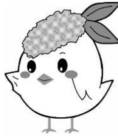
サガビー横向き(ロゴなし)