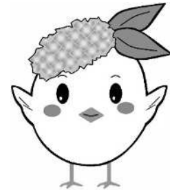
サガビー両手上げ(ロゴなし)