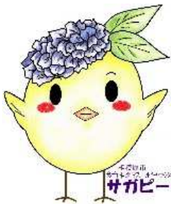
サガピー両手上げ(ロゴ付き)