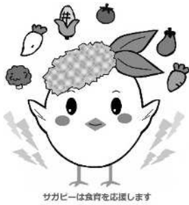
サガビー食育応援