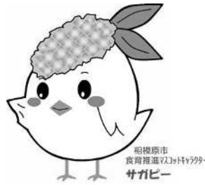
サガビー横向き(ロゴ付き)