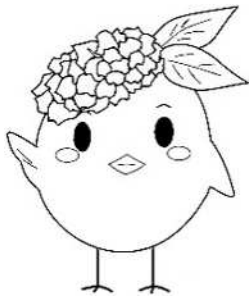
サガビー右手上げ(ロゴなし)