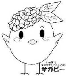
サガビー両手上げ(ロゴ付き)