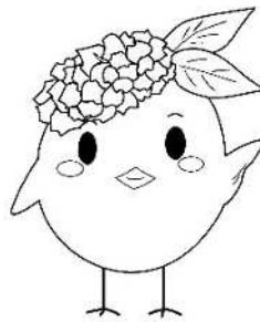
サガビー左手上げ(ロゴなし)