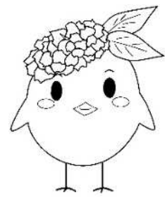
サガビー正面(ロゴなし)