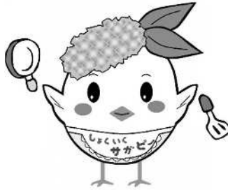
エプロンサガビー