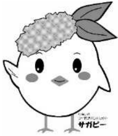
サガビー右手上げ(ロゴ付き)