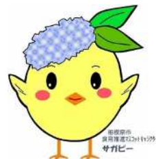
サガピー両手上げ(ロゴ付き)