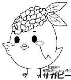
サガビー横向き(ロゴ付き)