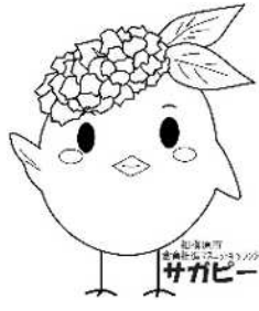
サガビー右手上げ(ロゴ付き)