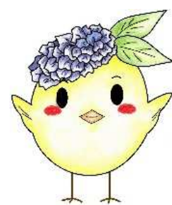
サガピー両手上げ(ロゴなし)