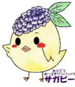
サガピー横向き(ロゴ付き)