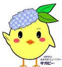
サガピー右手上げ(ロゴ付き)