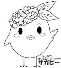
サガビー左手上げ(ロゴ付き)