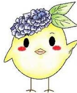
サガピー左手上げ(ロゴなし)