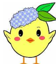
サガピー両手上げ(ロゴなし)