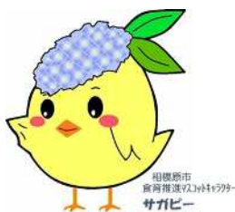
サガピー横向き(ロゴ付き)