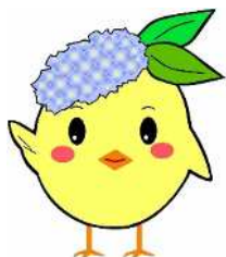
サガピー右手上げ(ロゴなし)