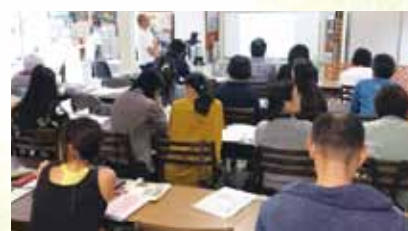
地域住民対象未病サポーター養成講座