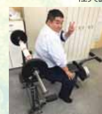
筋トレマシーン常設