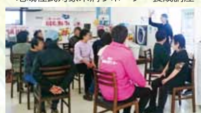
地域住民対象健康体操教室