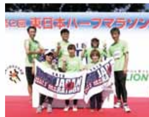
マラソン部です！ 大会に向け練習頑張ってます