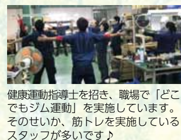
健康運動指導士を招き、職場で「どこでもジム運動」を実施しています。そのせいか、筋トレを実施しているスタッフが多いです！