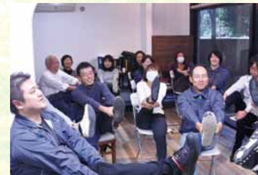
全員参加の運動教室 声をかけあい早速実践!