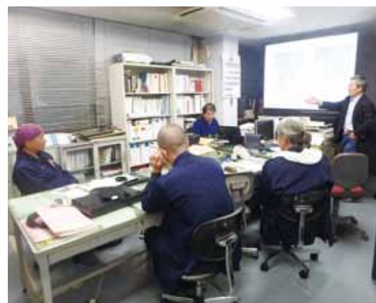
事故を起こさないため、定期的に検討会を実施