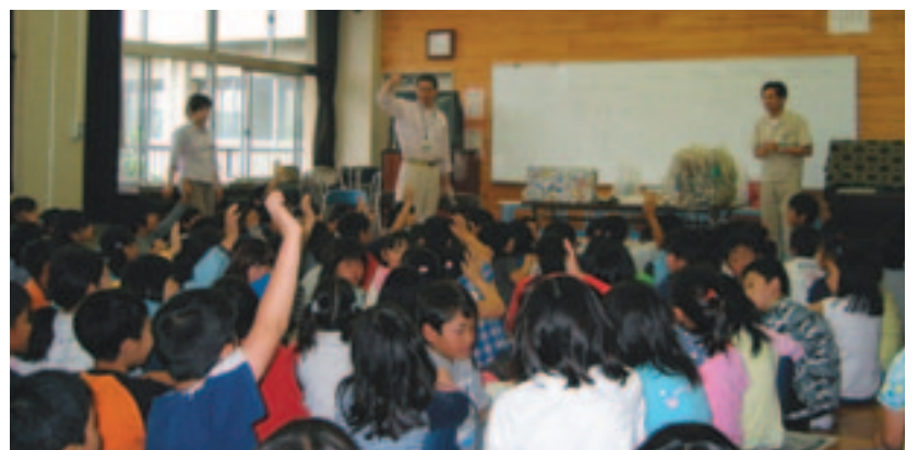
▲「自分たちにもできることから分別を始めます。」と発言してくれました。共和小学校4年生「総合的な学習の時間」

このため市では、小・中学校での「総合的な学習の時間」や「社会科の授業」、子ども会や自治会でのごみの減量化・リサイクルなどをテーマに実施する環境学習に対して職員を派遣します。ご相談、ご依頼は、ごみ減量推進課または総合学習センター(042-756-3443)まで。