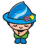
相模原市マスコットキャラクター 「さがみん」