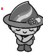
相模原市マスコットキャラクター 「さがみん」