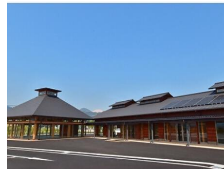
足柄・金太郎のふるさと