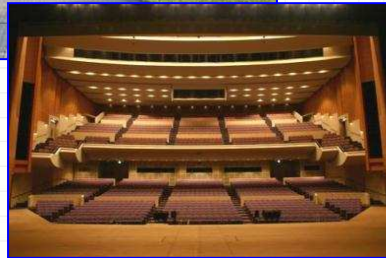
相模女子大学グリーンホール