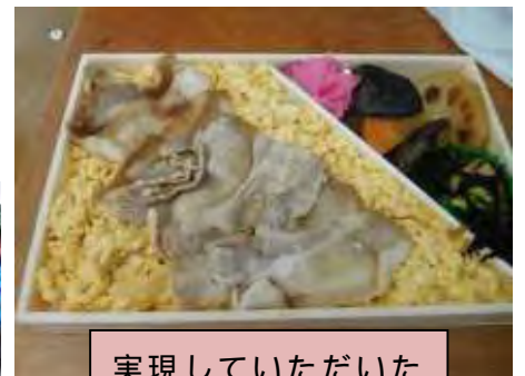
実現していただいた お弁当

今後は、「駅前広場デザイン」に取り組んでいるクラスや「おみやげ開発」に取り組んでいるクラスと協力して、「橋本まちづくり会議」を開催し、これまで学習に関わってくださった方々をお招きし、これからの橋本のあり方について提案したり、話し合ったりする予定です。