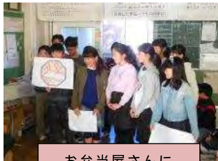
お弁当屋さん 思いを伝える