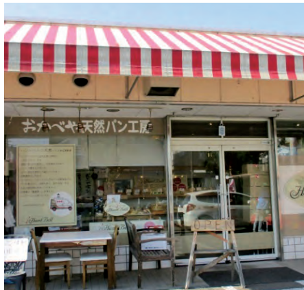
「天然パン工房」で撮影