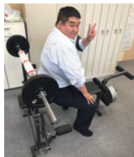
筋トレマシーン常設