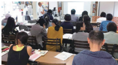
地域住民対象未病サポーター養成講座