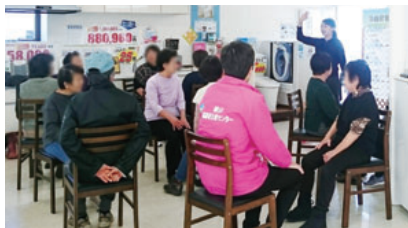
地域住民対象健康体操教室