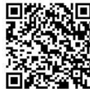
▲申請書ダウンロードページ