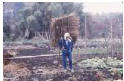
せおいぼしこ 背負梯子の使用(南区下溝)