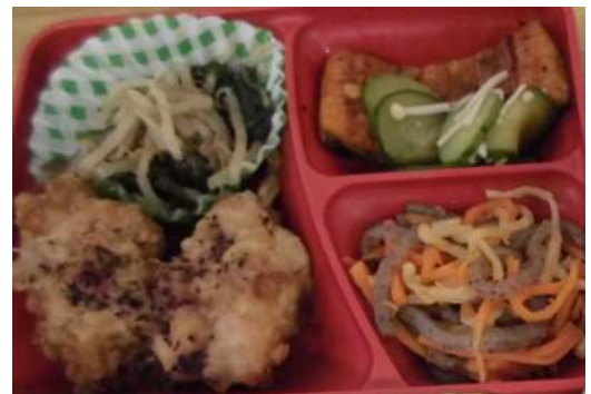
昨年度提供の給食（H29.7.18実施） 右上枠内が「うなぎの蒲焼き」