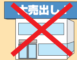
建物からはみ出す屋上広告

地域ごと(商業地・住宅地・国道沿道など)に、掲出できる面積や高さなどの基準があります。また、一部地域には、地色の制限があります。付け替えるときも、基準を守る必要があります。