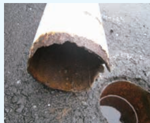
ポール看板の倒壊

早めに処置すれば、サビを落とし保護材を 塗布すれば済むものも、放っておくと取替え や大規模補修により 多額の費用 がかかり、事故 が発生した場合は 賠償責任 を問われることも あります。