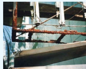
袖看板の底部脱落