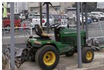
運動場等の維持管理用トラクター

なお、財産台帳に登録すべき車両に係る種目の取扱いに関する基準等は、特に定められていない状況であった。