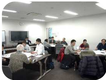
「私が描く相模原ビジョン」

子育て支援のボランティアにはたくさんの種類があって、年齢もさまざまで、できることがあるとわかった。ぜひ、何かやってみよう。(専門講座「誰でもできる子育て支援」)