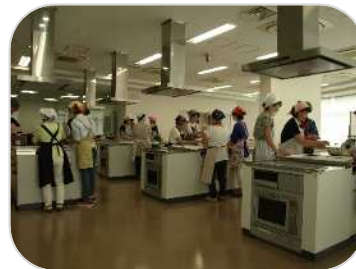
「郷土の味「酒まんじゅう」を作ろう」