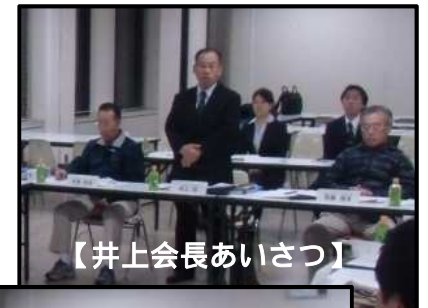
【井上会長あいさつ】