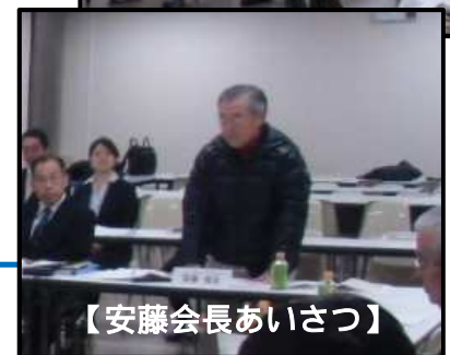
【安藤会長あいさつ】