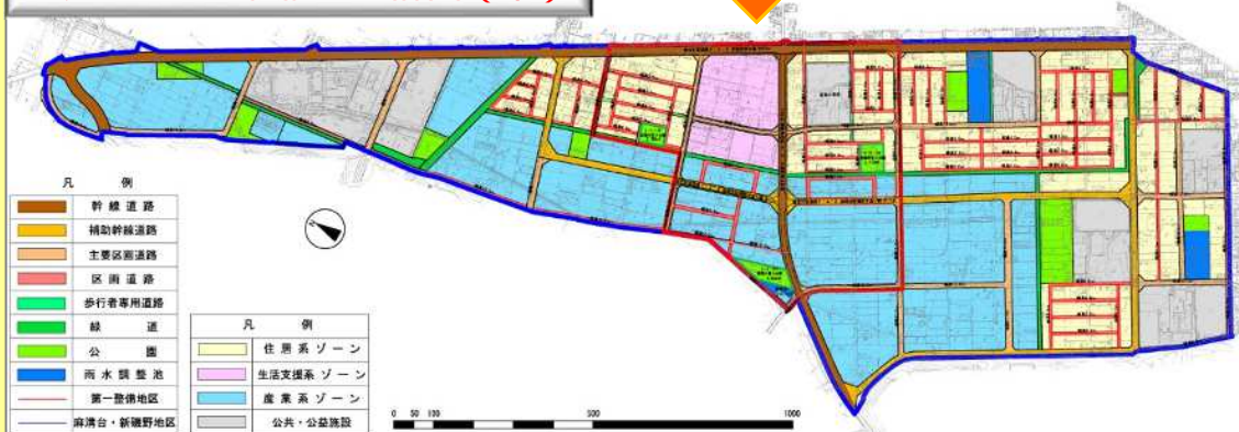
意見をもとに検討した計画（案）

具体的な検討内容については、第3回まちづくり研究会（権利者全体説明会）においてご説明いたします。