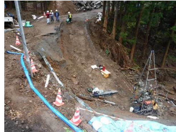
ゆぐちさわばし 湯口沢橋手前