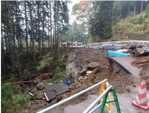
さかいざわばし 境沢橋手前