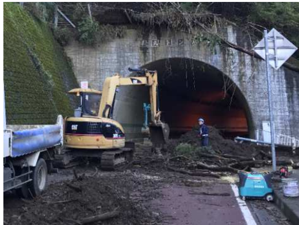
ひらまる 平丸トンネル手前

、 は直轄権限代行の作業状況（写真は11月11日撮影） は市施工の作業状況（写真は11月12日撮影）