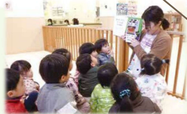
Hさん 幼保連携型 認定こども園ひかりキッズ

就職・退職・子育て・復帰と、一つの園に長く関わっていますが、その間に、産休・育休の制度ができました。私が活用したように、さまざまな雇用形態も整ってきています。私のように、復職しづらいと感じている人にも、今の保育の現場は、かなり柔軟な職場になっていることを伝えたいですね。