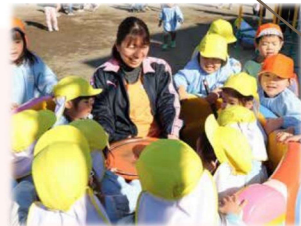
Kさん 清水こども園

ブランクを経ての復職には不安がありましたが、子育てを経験したことが、仕事に生かせていると感じています。私自身、わが子を別の園に預けて、保育士に助けられながら働いているので、昔より保護者の方の気持ちに寄り添えるようになりました。