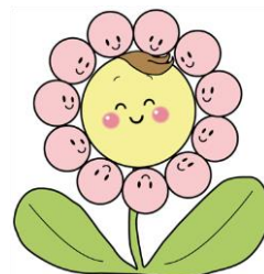
はなたん 相模原市子育て応援 イメージキャラクター

住 所：相模原市中央区向陽町 8-23 電 話：042-751-9695 時 間：午前9時～午後5時 休館日：毎月第3日曜日、年末年始