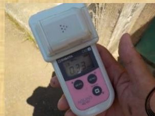
▲水道水に含まれる次亜塩素酸濃度を測定し、水質検査を行っています。

また、水道の安定供給には日々の施設点検や水質検査も欠かすことはできません。津久井土木事務所では毎日、日常点検を実施しており、市営簡易水道の供給エリアである青根地区、藤野地区の10か所以上の現場を回り、安全安心の水道の供給に努めています。