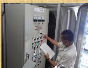
▶ 各水道施設を巡回し、計器を見ながら、機器に異常がないか確認しています。