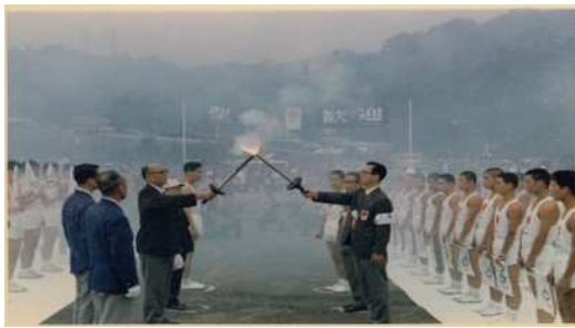
1964年聖火リレー：引継写真と聖火リレートーチ