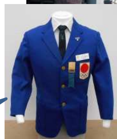
カヌー競技役員ブレザー