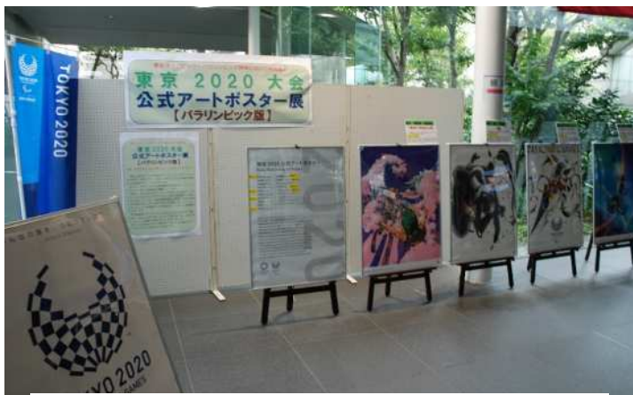
東京2020公式アートポスター（展示イメージ）