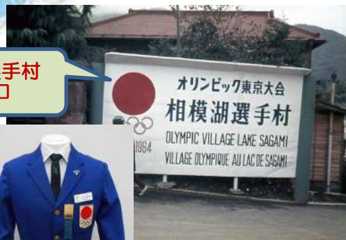
相模湖選手村の入口