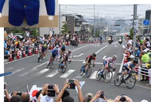
自転車ロードレース