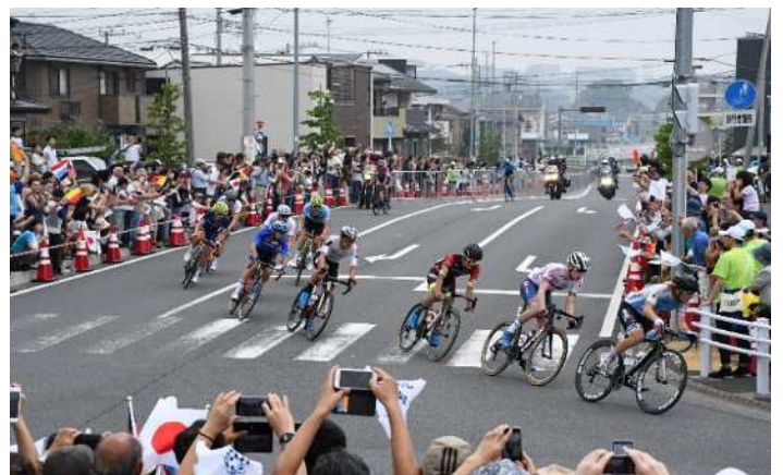
自転車ロードレース写真（写真はテストイベント時）