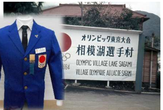
1964年カヌー競技：相模湖選手村と役員ブレザー