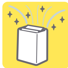
空気清浄機の購入