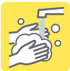
自動水栓への交換工事