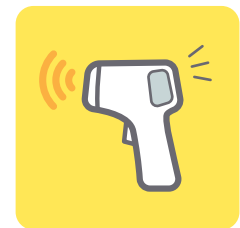
非接触型検温器の購入