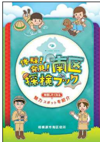
「体験！発見！南区探検ブック」

南区の自然、文化、歴史、イベントなどの概要や南区の地図を掲載した「南区ガイドマップ」と、お出かけしたくなる、人に話したくなるような南区の魅力あるスポットを区内の小学生たちと一緒に探検し、作成した「体験！発見！南区探検ブック」のPDF、電子書籍を市ホームページに掲載しています。