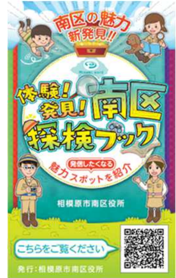
「相模原市南区PRカード」見本