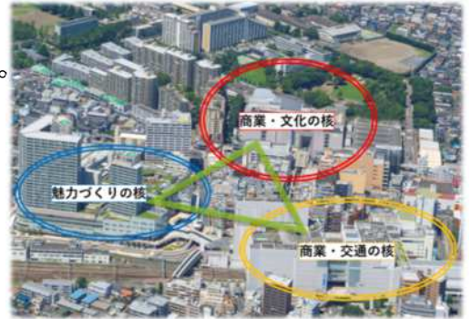
三核構造によるまちづくり

しかし、伊勢丹相模原店の閉店や新型コロナウイルス感染症の影響による来街者の減少など相模大野駅周辺を取り巻く環境は大きく変化していることから、既存の公共的空間の活用等を図るとともに地域と協働しながら、ソフト施策を中心としたまちづくりを進めるもの