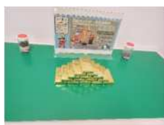
金のレプリカ (令和3年度回収分相当)

期間 令和4年6月1日(水)から30日(木)まで 場所 市役所本庁舎本館1階「さがみはらインフォメーション」コーナー 内容 回収した実際の砂や金のレプリカのほか、ごみ分別の重要性や持続可能な社会の実現に向けた取組の啓発パネル等を展示します。