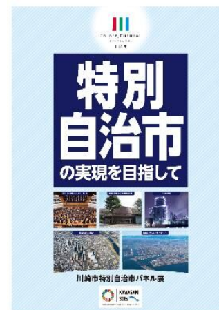
ポスターイメージ