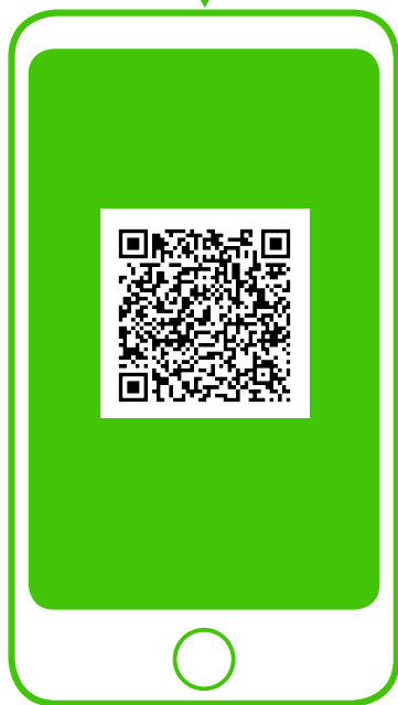
※新型コロナ対策パーソナルサポート (行政) QRコードから登録