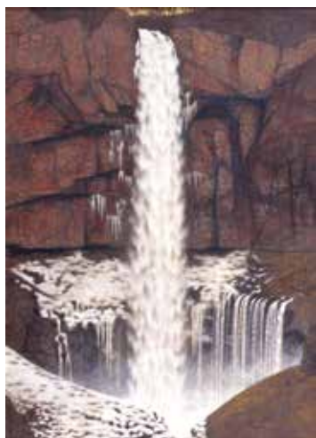
表上部 | 岩橋英遠 《眠雲 2》1989 年 / 表下部 | 岩橋崇至 《双六岳と槍・穂高連峰》1999 年 1 | 岩橋英遠 《ブロッケン》1999 年 2 | 岩橋英遠 《北辺夏晨》1991 年 3 | 岩橋崇至 《ジャンダルム》1999 年 4 | 岩橋英遠 《双壁・華厳》1963 年

本展は、岩橋英遠の生誕 120 周年を記念するとともに、昨年 11 月に惜しまれつつ逝去した岩橋崇至を追悼するものです。本展を通じ、自然と真摯に向き合い続けた父と子、ふたりのまなざしが宿った作品の数々を御堪能ください。