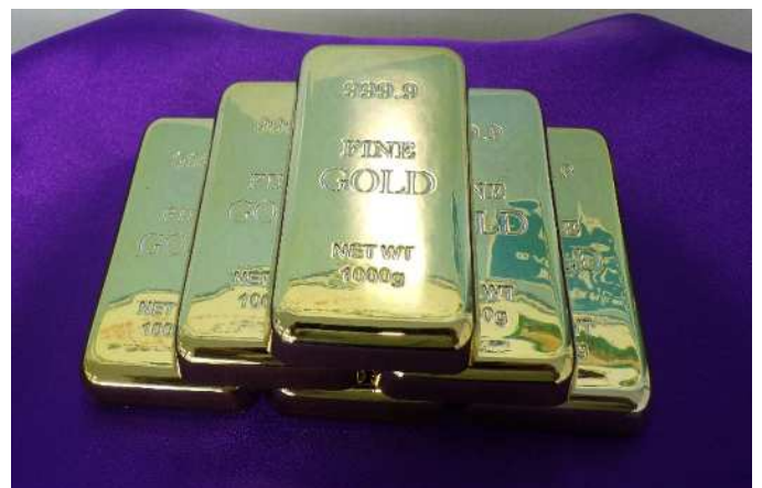
金のレプリカ(令和4年度回収分6kg相当)

焼却炉の砂から貴金属を回収していますが、市民の皆様がごみを分別することでより効率的な資源の回収が可能です。ご協力をお願いいたします。