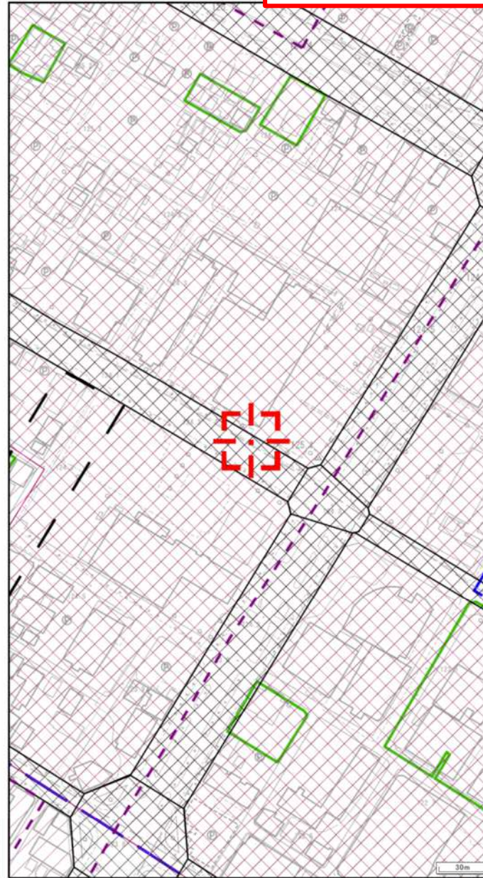
A3サイズで縮尺 1 / 2500 相当