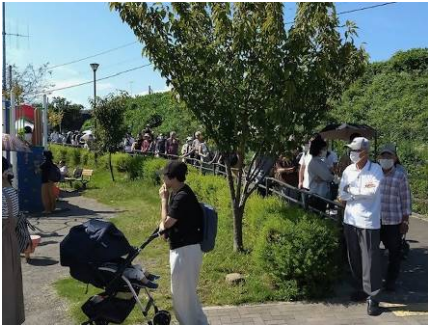
▲開始の11時前から大行列