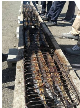
▲今や高級魚サンマの仕入れは1,000。焼いて焼きまくる！