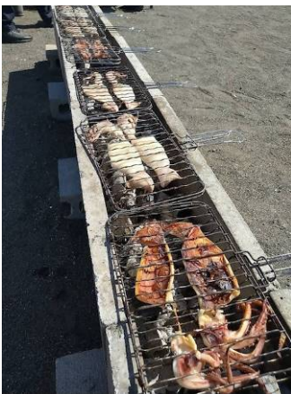
▲仕入れたイカは200。焼きに焼いて！