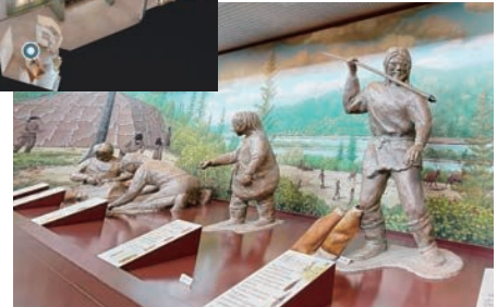
史跡田名向原遺跡旧石器時代学習館(旧石器ハテナ館)