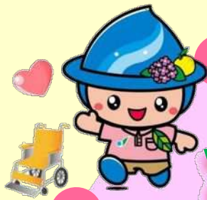
相模原市 マスコットキャラクター 『さがみん』