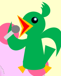
ハローワーク相模原 オリジナルキャラクター ひばりん