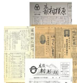
合併前の市・町の広報紙

展示では、現在の相模原市が旧4町（城山町、津久井町、相模湖町、藤野町）と合併する前の様子（市（町）制施行、軍都、東京オリンピック等）を、資料を通して振り返ります。