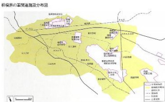
相模原の軍関連施設分布図