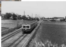
小田急線（昭和30～40年代）