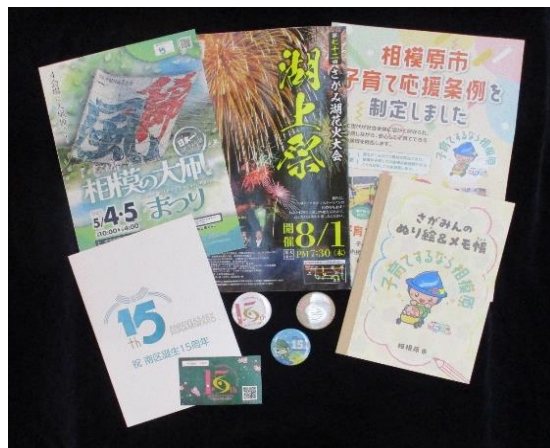
収集した広報的資料の一部

(相模の大凧まつり令和7年リーフレット、子育て応援条例普及啓発資料のチラシ・ぬり絵ノート、緑区・中央区・南区誕生15周年記念缶バッジ等)