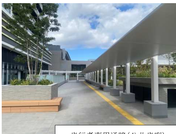
歩行者専用通路（公共歩廊）