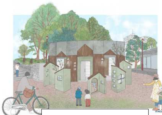
トイレ(改修後イメージ図)