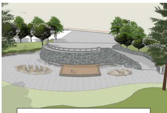
水景施設(改修後イメージ図)

親子で使える明るいトイレになるように、外装は市、内装は野村不動産株式会社がリニューアルします。