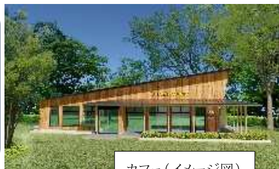
カフェ(イメージ図)