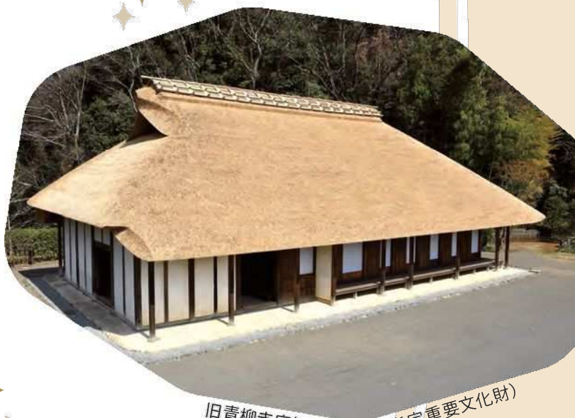
旧青柳寺庫裡(神奈川県指定重要文化財)