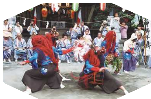
大島諏訪明神の獅子舞 (神奈川県指定無形民俗文化財)