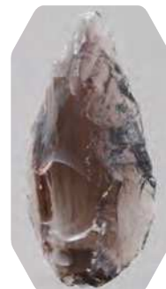
相模原市田名向原遺跡の 住居状遺構出土の旧石器時代石器群 (神奈川県指定重要文化財(考古資料))