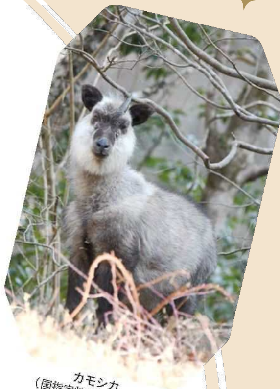
カモシカ (国指定特別天然記念物)