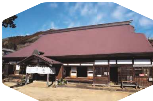
小原宿本陣(神奈川県指定重要文化財)