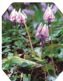
カタクリの自生地 (神奈川県指定天然記念物(植物))