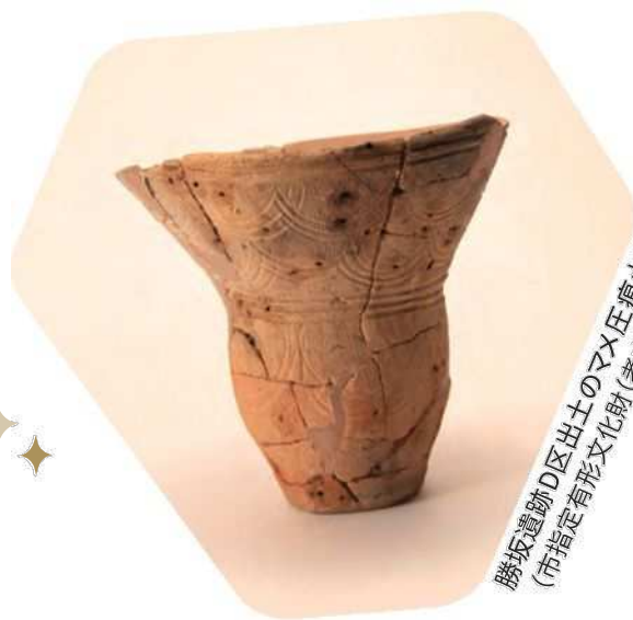
勝坂遺跡D区出土のヤマト土器 (市指定有形文化財(考古資料))