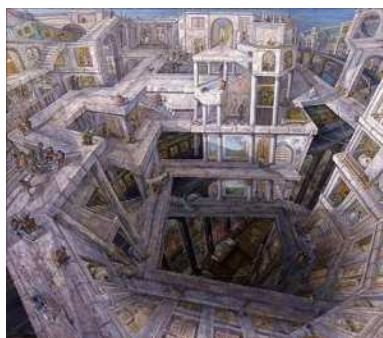
遠藤 彰子《迷宮の街》1983年