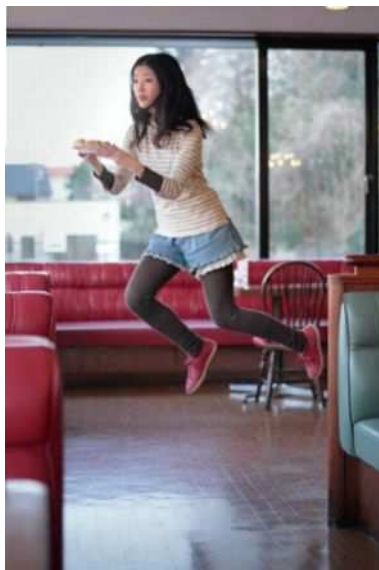
林 ナツミ《Today's Levitation 01/31/2011》2011年