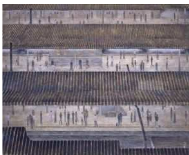
吉村 誠司《プラットホーム》1989年