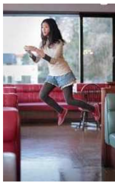
林ナツミ 《Today's Levitation 01/31/2011》 2011 年