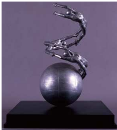
後藤 良二《球体上の螺旋運動》1983年