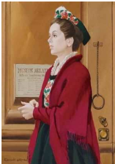
奥津 国道《アルルの女》1970年 - 1980年頃