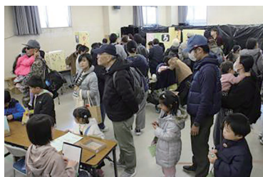
混雑するゲームブース