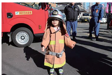
消防士になってごきげん