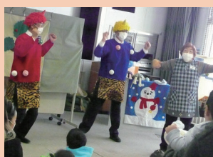
鬼さんをやっつけろ～！