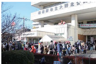
開始前にこの行列！