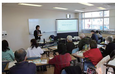
熱心に聞き入る参加者