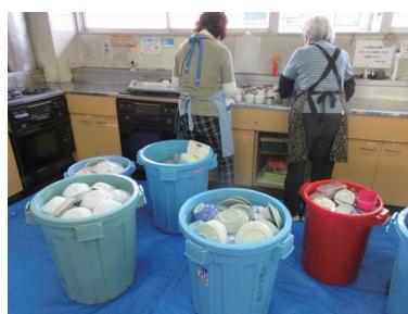
すべての食器をきれいに

利用サークル協議会の皆さんの協力で、年末大掃除が行われました。たくさんのご参加ありがとうございました。