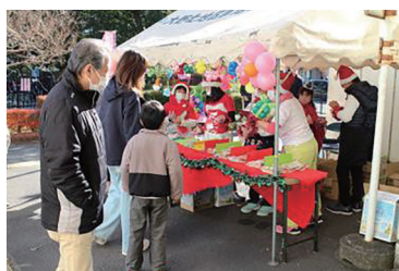
お菓子・パン売り場