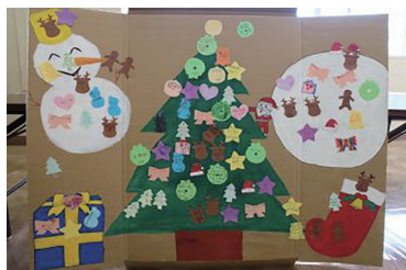
みんなで飾り付けたツリー

当日は天候にも恵まれ多くの来場者でにぎわい、各模擬店やアトラクションは大盛況で、うれしい悲鳴が上がるほどでした。また地元の消防団からは消防車（消防団車両）が展示・乗車体験に参加してくれました。