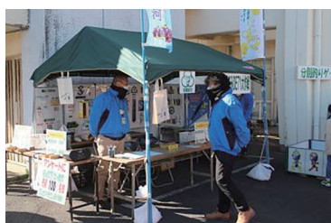
ごみ DE71 大作戦ブース (でない)