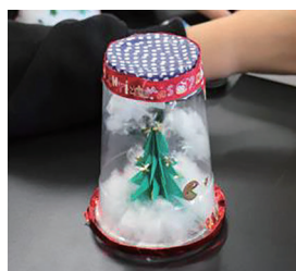
完成したスノードーム