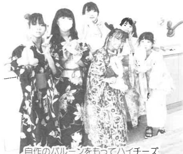
自作のバルーンをもってハイチーズ