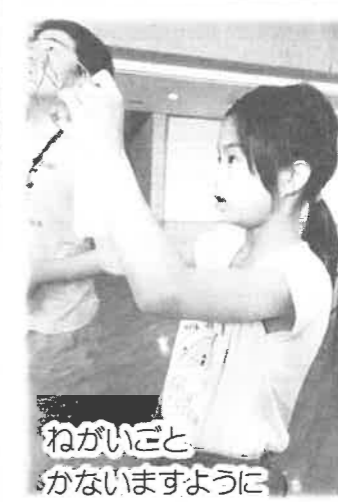
ねがいごと かないますように