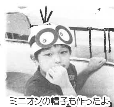
ミニオジの帽子も作ったよ