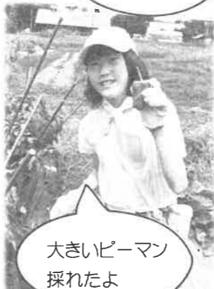
大きいピーマン 採れたよ