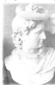
石膏像もお祭り気分