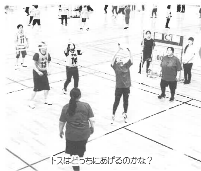
トスはどちらにあげるのかな?