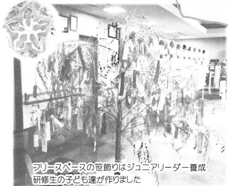
フリースペースの笹飾りはジュニアリーダー養成研修生の子供達が作りました