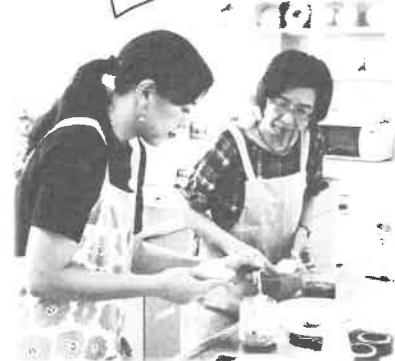
終わる頃にはバジルの香りが漂う料理実習室でした

醤油ベース薬味麺(麺、長ネギ、ミョウガ、にんにく、生姜、醤油)、塩ベースイタリアン麺(麺、玉ねぎ、トマト、にんにく、バジル、塩、水)を作りました。肉、魚、野菜、何にでも合います。イタリアン麺にチーズとケチャップをのせれば子どもに人気のピザトーストの出来上がりです。ピザトーストは子どもさんに人気だそうです。薬味麺は冷ややっこや素麺などに合いますよ。