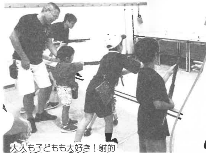
大人も子どもも大好き! 射的