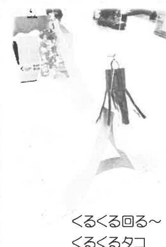
くるくる回る～ くるくるタコ