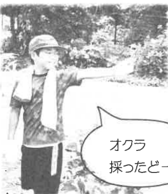
オクラ 採ったどー