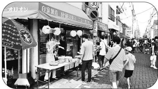
▶チョコバナナは大人気！

夕見自治会長曰く「自治会を脱退する人が今以上に増えてくるとお祭りを続ける事も難しくなるかもしれません。とにかく、役員さんや会員の方々の理解と頑張りのお陰なんです。感謝しています。」 台風が心配でしたが予定通り開催できてよかったです。」と貴重な休憩時間に話してくださいました。