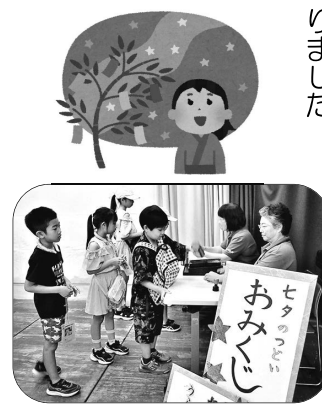
▲何を占ったのかな～！