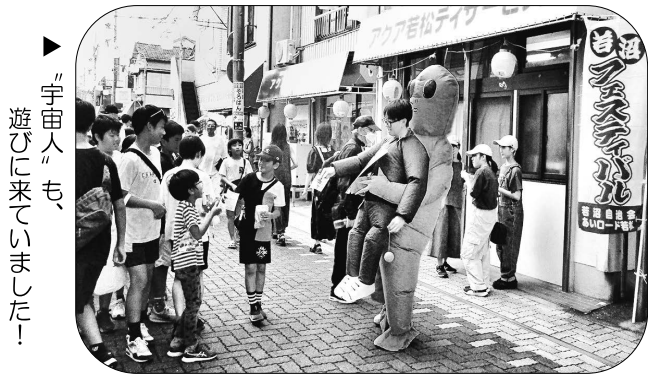
▶「宇宙人」も、遊びに来ていました！