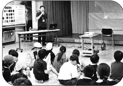
▲「夏の星や星座」のお話！