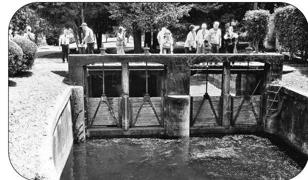
▲相模原ゴルフクラブのご好意で、敷地内に入らせて頂き、貴重な見学会でした。

7月最後の日曜日、27日の夕方7時から、慰霊塔広場で今年も「セミの羽化」を観察しました。 陽が落ちて少しはしのぎやすくなった頃、10組27名の親子が懐中電灯を持って集まってきました。 「グリーン相模原シェアリングネイチャーの会」の方から事前予約した椅子を受けて、いざ森の中へ！ 数匹のニイニゼミとアブラゼミが、すでに木の幹を登っていました。