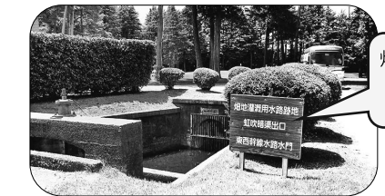
畑地灌漑水路跡地 虹吹暗渠出口 東西幹線水路水門