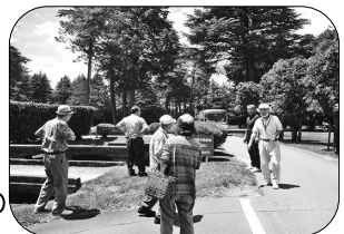
整備された静かなゴルフ場の中で、しばし深呼吸タイム！

最終日は、まとめ講義や質問タイム、最後に、先生から「バスで地域巡りをすると、大沼公民館文化部はスゴイ！」との言葉を頂きました。