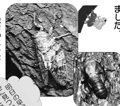
▲背中が割れて羽が見えてきました

短時間で羽化しますが、大きいアブラゼミの羽化は時間がかかります。ほとんどのご家族がニイニゼミの羽化を見守ることができました。