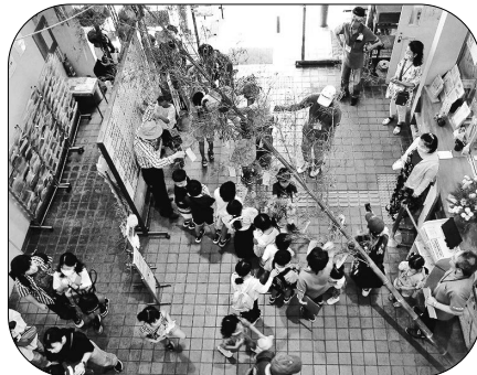
▲願いを竹に乗せて、天まで届け～！

飾り付けが終わった後は、魚つりやヨーヨー、輪投げ、おみくじ、綿あめなど、賑やかで楽しい時間を過ごしました。