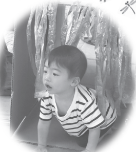
段ボールのトンネルから ばあー