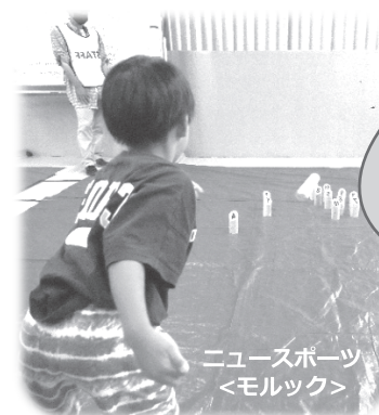
ニュースポーツ <モルック>