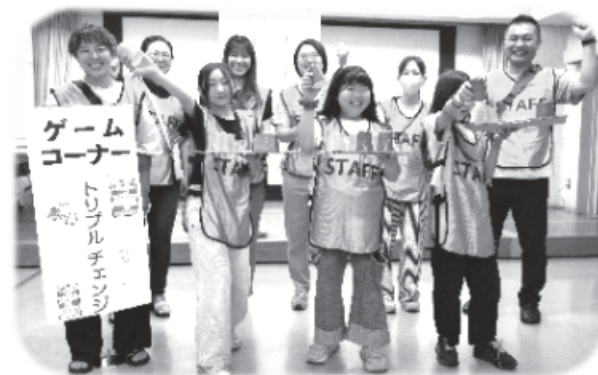
大人サポーターの皆さんのご協力、ありがとう!