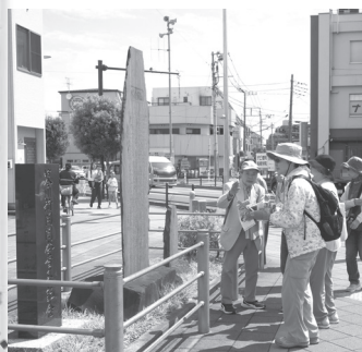
●中和田新開 開拓集落跡地

このまちには歴史も浅くそれまでは原野の続く相模野台地。昭和になって「軍都計画」により広大な農地、山林が軍の施設になった。その後、跡地が開墾地としてよみがえり、新たな農地は住宅地や公団住宅になった。人口増加と都市化が進み現在に至っている。