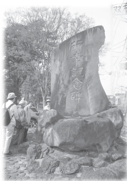
国立相模原病院に建っている「行幸記念碑」●