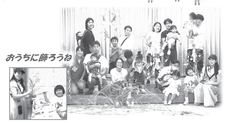
あうちに飾ろうね

子どもたちからの鋭い質問にもわかりやすい言葉を使って丁寧に回答していただき、大人も子どもも楽しい学習の時間となりました。