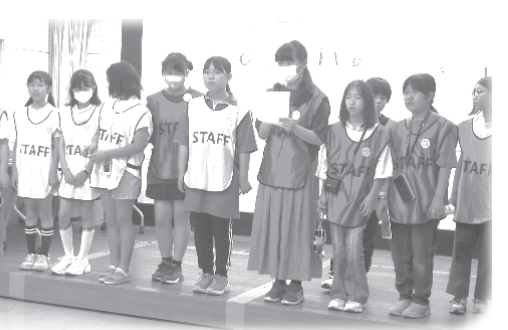
＼頑張りました!／ 子どもスタッフのみなさん