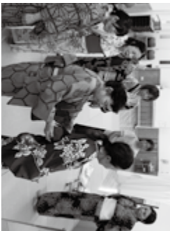
浴衣の柄や帯の結び方にもそれぞれ個性が光りました