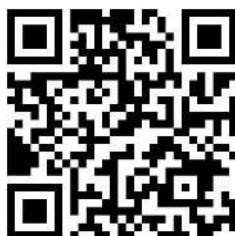
相模原市人事委員会 X