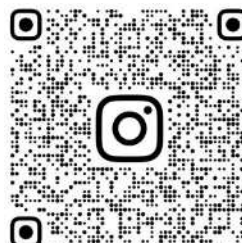
相模原市職員採用 Instagram

この受験案内は、全ての採用試験が終了するまで使用します。 必ずお手元に保管しておいてください。