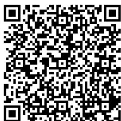
相模原市職員採用案内 HP

相模原市ホームページアドレス https://www.city.sagamihara.kanagawa.jp/