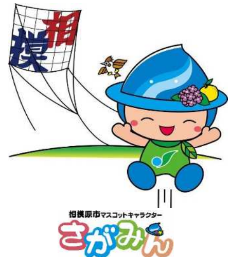
相模原市マスコットキャラクター