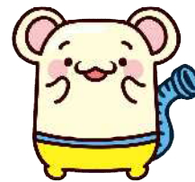
下水道PRキャラクター「くーりん」