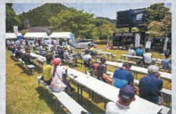
フィニッシュ会場での大型ビジョン放映やブース出店