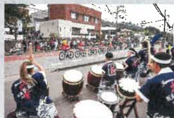
地域との盛り上がり